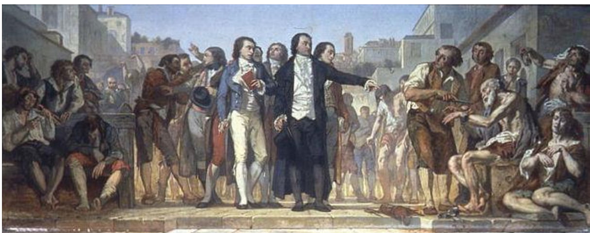
1793: Gemälde von Charles Louis Lucien Müllerin der Lobby der Académie Nationale de Médecine, Paris

Es gibt ein Bild: Herr Pinel befreit die Kranken von ihren Ketten: