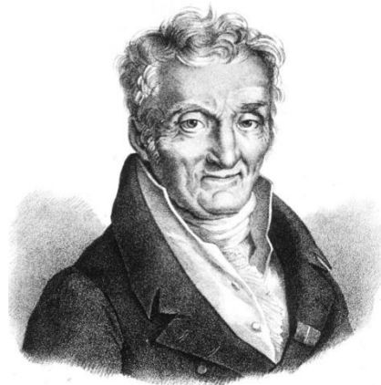
Philippe Pinel: 1745 – 1826

Revolution (1789) zurück. Im Jahre 1793 übernahm der Arzt Philippe Pinel die Leitung einer Klinik in Paris.